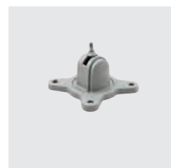
KONZOL A RÖGZÍTŐ ADAPTEREKHEZ KÓD: FSD030