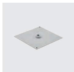
RÖGZÍTŐ ADAPTER 1 PRIZMÁHOZ KÓD: FSD031