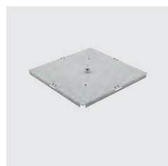
RÖGZÍTŐ ADAPTER 4 PRIZMÁHOZ KÓD: FSD032