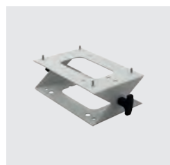
FALI KONZOL KÓD: FSD029