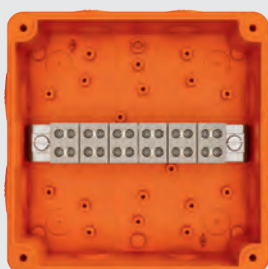
CSATLAKOZÓK VÍZSZINTES HELYZETBEN